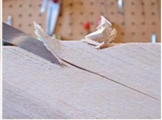
Contre le grain

Il faut éviter de couper contre le grain du bois car cela le fend.