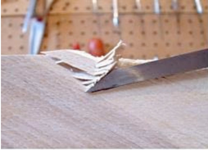
Avec le grain