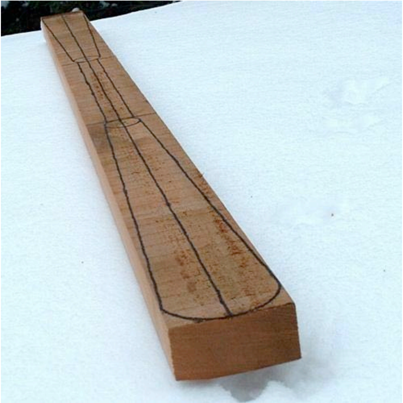
La tracé de la pagaie sur le 2x4.